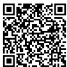
QR-Code Meldeplattform Asiatische Hornisse

Dies ist über die Meldeplattform auf der Homepage der Landesanstalt für Umwelt (LUBW), aber auch über die kostenlose „Meine Umwelt-App“ möglich: