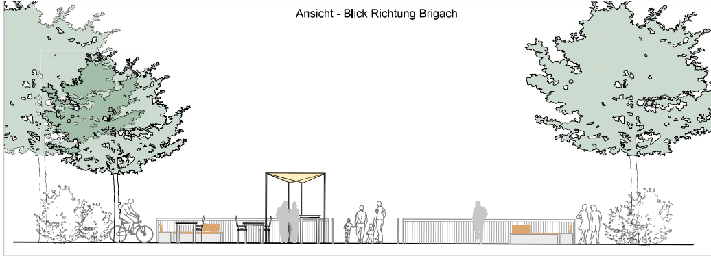
Ansicht - Blick Richtung Brigach

Relevante Wasserspiegel an Achse (DHNZ2016): WSP MG-Hst: 699,329 m ü. NNH WSP MÜ-Hst: 699,376 m ü. NNH WSP MO-Hst: 699,496 m ü. NNH = Stützseignagel WSP HD 30 -Plan: 701,174 m ü. NNH